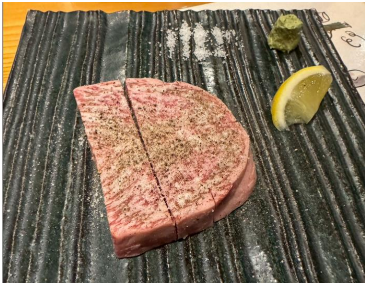
シャトーブリアン